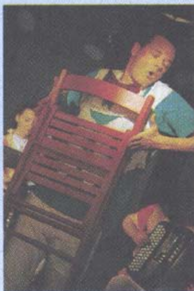
Un spectacle de chansons et d'histoires aux accords multicolores.

► Jusqu'au 28 avril , à 20 h, à l'Artichaut, 56, Grand'Rue, tarif : 5 €. ☎ 03 88 25 77 71.